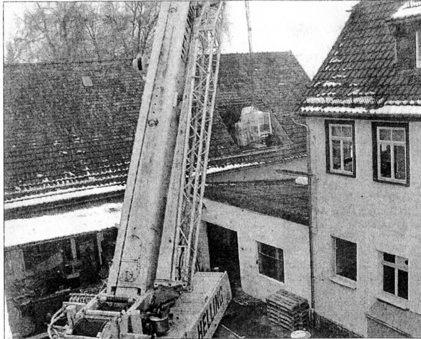
Die tonnenschwere Exzenter-Pressen zur Herstellung von Stanz- und Ziehteilen wird vom Autokran übers Dach ans Tageslicht befördert.